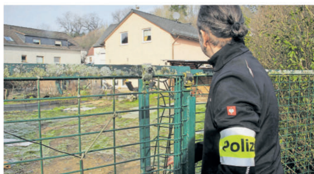
Ermittler der Polizei vor dem Haus im Eifelort Hersdorf, in dem Mitte Januar der 56-jährige Bewohner ermordet wurde.

Nach der Festnahme der beiden im Hersdorfer Fall verdächtigen Serben hieß es, dass es zu möglichen Vorstrafen des Duos keine Erkenntnisse gebe. Einer der Beschuldigten sei erstmals 2010, der andere erstmals 2011 nach Deutschland eingereist. Beide sollen unabhängig voneinander mehrfach Asylanträge gestellt haben, die abgelehnt worden seien. Beide hätten Deutschland zwischendurch wieder verlassen und seien unabhängig voneinander wieder eingereist.