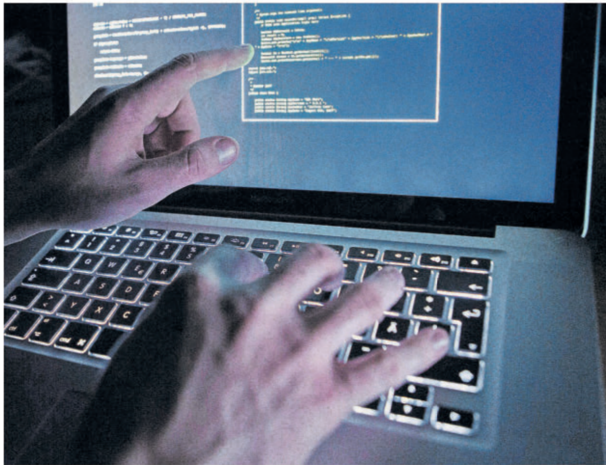
Die künftigen IT-Spezialisten sollen die rheinland-pfälzische Polizei bei Strafermittlungen im Internet unterstützen.

In einem Jahr vom IT-Experten zum Kriminalbeamten „Die fortschreitende Digitalisierung des Alltags beeinflusst auch die Kriminalitätsentwicklung, sodass der Bedarf an weiteren IT-Spezialistinnen und -Spezialisten besteht“, erklärt ein Sprecher des rheinland-pfälzischen Innenministeriums in Mainz auf TV-Nachfrage. Was den Speziallehrgang besonders macht: Der Unterschied zu den bisher extern eingestellten IT-Spezialisten bestehe darin, dass