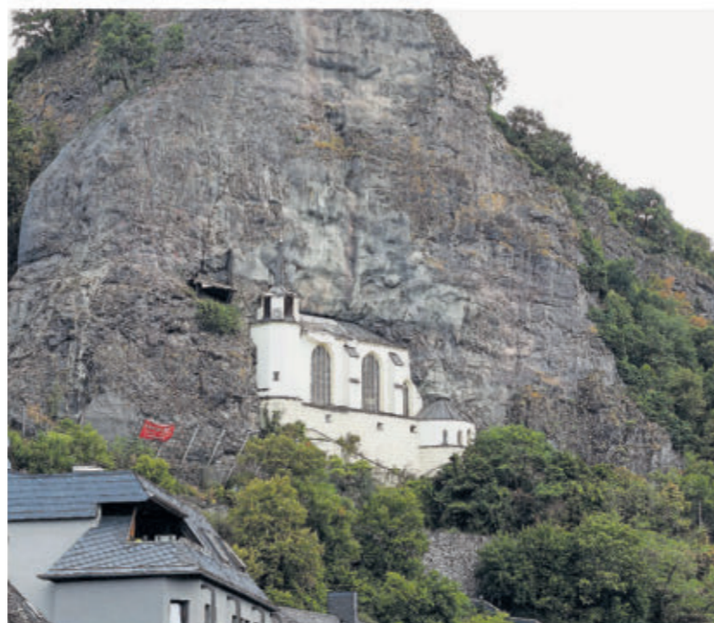
Unterhalb der Felsenkirche wurden in Idar-Oberstein zahlreiche Menschenknochen gefunden. Nun konnten sie teilweise zugeordnet werden.

Seit dem Frühjahr 2019 führte eine Spezialfirma unterhalb des Schlosses und seitlich der Felsenkirche in Idar-Oberstein umfangreiche Felsicherungsarbeiten durch. Der Steilhang wurde bei dieser Maßnahme von Gestrüpp, Wildwuchs und Bäumen befreit und der Hang komplett mit Stein-schlagnetzen gesichert. Am 19. März 2019 stießen die Arbeiter erstmals auf Knochen, die vermutlich menschlichen Ursprungs waren. Die Kriminalpolizei übernahm die Ermittlungen. Im weiteren Verlauf der Rodungsarbeiten wurden bis 2022 insgesamt 60 Knochen- und Knochenfragmente aufgefunden. Die Rechtsmedizin der Universitätsklinik Mainz wurde mit den